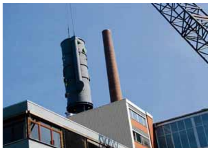
Mit einem riesigen Kran (Ausleger: 95 Meter lang) wurden die 120-Tonnen-Kessel über das Verwaltungsgebäude des Südzucker-Werks hinweg in die Fabrikhalle gehievt. Das Unternehmen erneuert in diesem Jahr das Werk in Rain für insgesamt über fünf Millionen Euro.

Wie viele Beschäftigte haben Sie? Schäfer: In Westendorf arbeiten wir zu dritt, zwölf Mitarbeiter sind in der Produktion in Rot tätig.