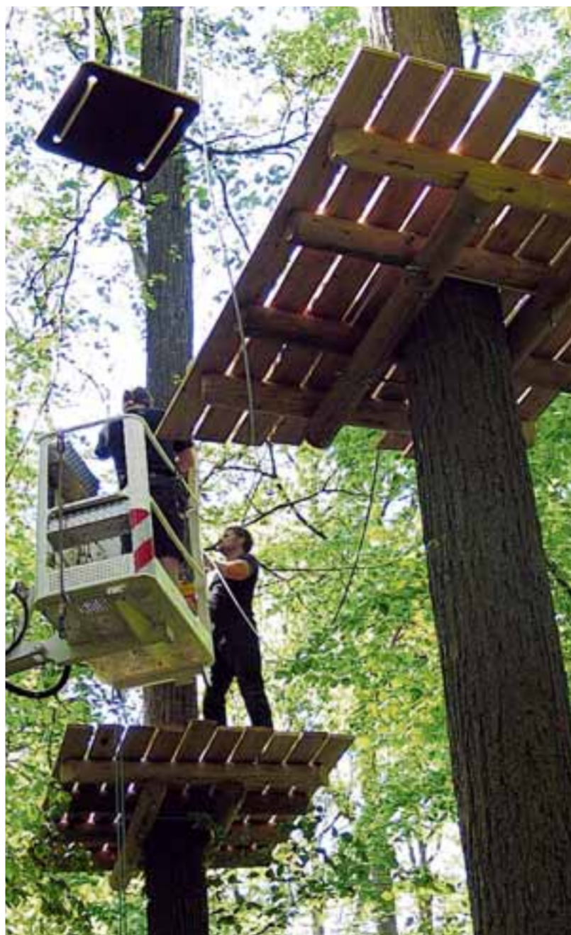
In einer Höhe von bis zu 14 Metern werden die Plattformen an den Bäumen angebracht und mit Stegen, Seilen, Hängebrücken etc. verbunden, damit sich ab 3. Juni die mutigen Seilkletterer hier beweisen können.

Infos: Geöffnet hat der Waldseilpark in Scherneck ab dem 3. Juni bis Oktober, täglich von 10 bis 19 Uhr. Alles Wichtige zum Kletterwald im Internet unter www.robins-wood.de