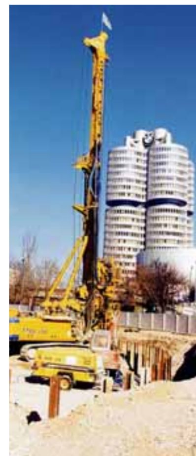
Die Bauer AG aus Schrobenhausen ist mit Spezialtiefbau und Maschinenbau im In- und Ausland erfolgreich.

Erfreuliches gibt es für die Aktionäre zu berichten. Neben dem Wertanstieg der Aktie – sie wurde beim Börsengang mit 16,75 Euro erstmals notiert und liegt mittlerweile bei über 50 Euro – gibt es pro Aktie eine Dividende von 50 Cent. Positiv ist auch die Entwicklung der Mitarbeiterzahlen. Waren es 2005 noch 5155 Mitarbeiter, so beschäftigte die Bauer AG für 2006 knapp acht Prozent mehr Mitarbeiter, nämlich 5541.